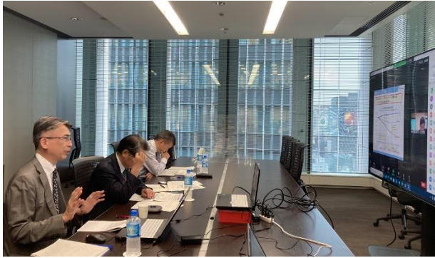
(奥から原・経団連常務理事、清水部会長、篠原上席 研究員)